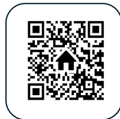
未来への架け橋 ホームページ