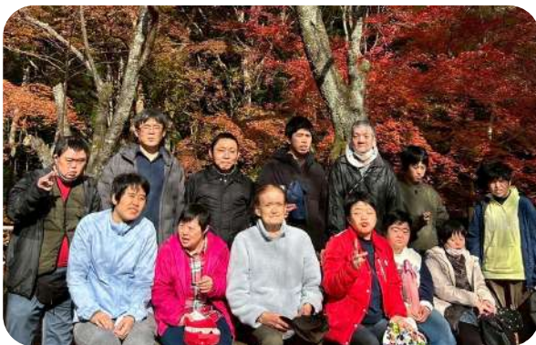
紅葉狩りへ行きました