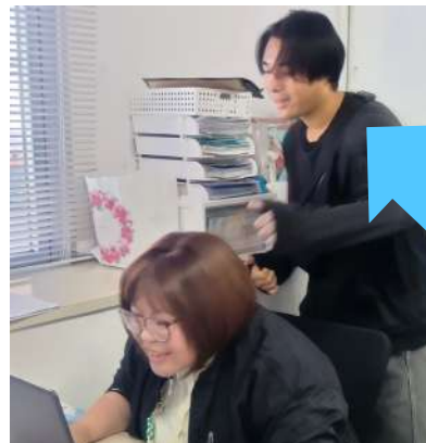
休憩時間のひとコマ